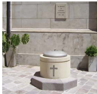
Foto: Cinerario de una parroquia de Buenos Aires. La foto es sólo para ilustración.

colocar placas recordatorias, porque además de correr el riesgo de desprolijidad, pueda dar lugar a la ostentación personal, creando diferencias.