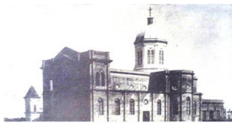
Iglesia La Cruz de los Milagros en construcción, año 1895.

Por la tarde: Con la participación de las Autoridades Provinciales y Municipales - 16,00 horas: PROCESIÓN (por las calles Buenos Aires, 25 de mayo y Salta). - Concluida la procesion -inmediatamente- SANTA MISA presidida por Monseñor Andrés Stanovnik, Arzobispo de Corrientes. - 19,30 hs: Santa Misa | 20,30 hs: Festival Folklórico | 24 hs: Última Misa